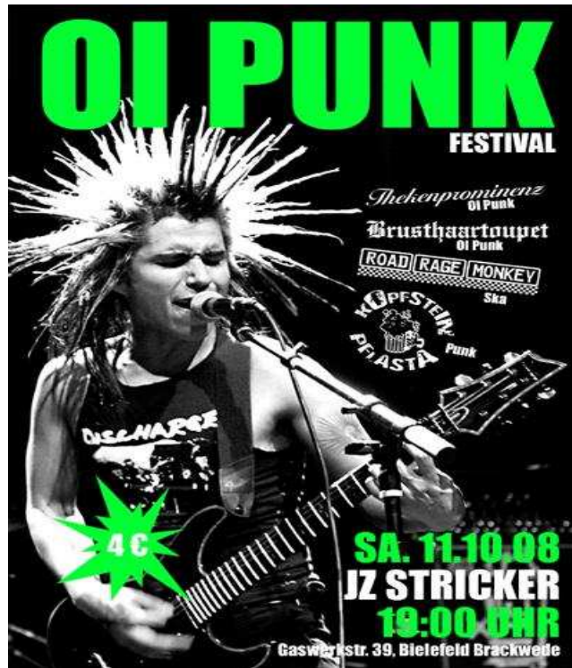
Oi Punk II