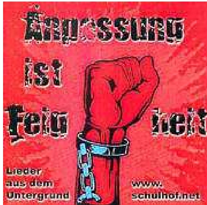
Anpassung ist Feigheit