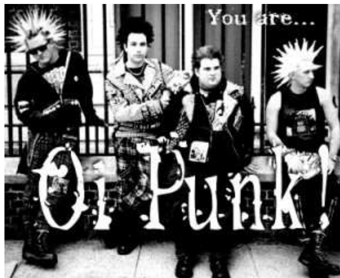
Oi Punk I