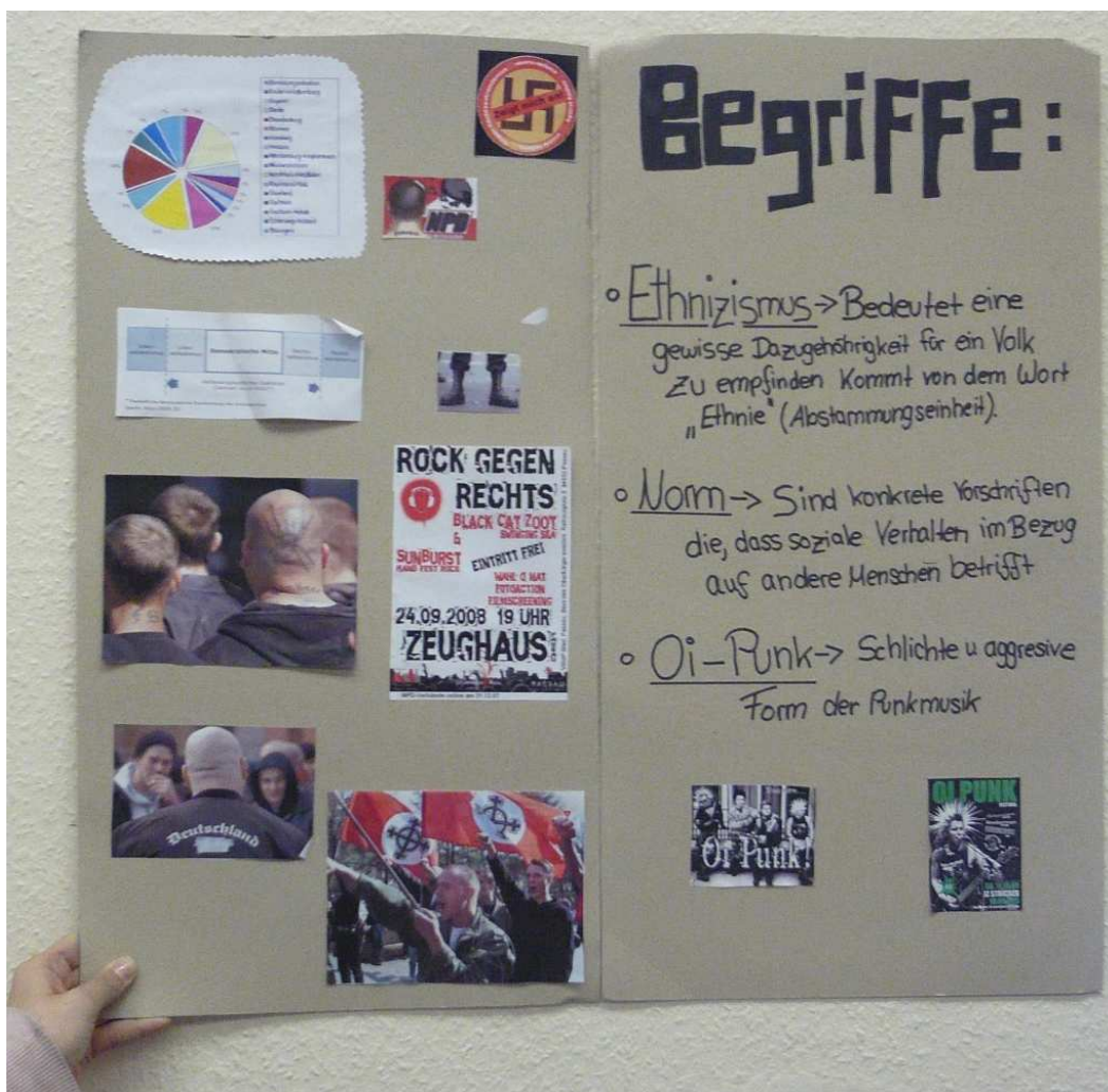
Plakat zum Referat